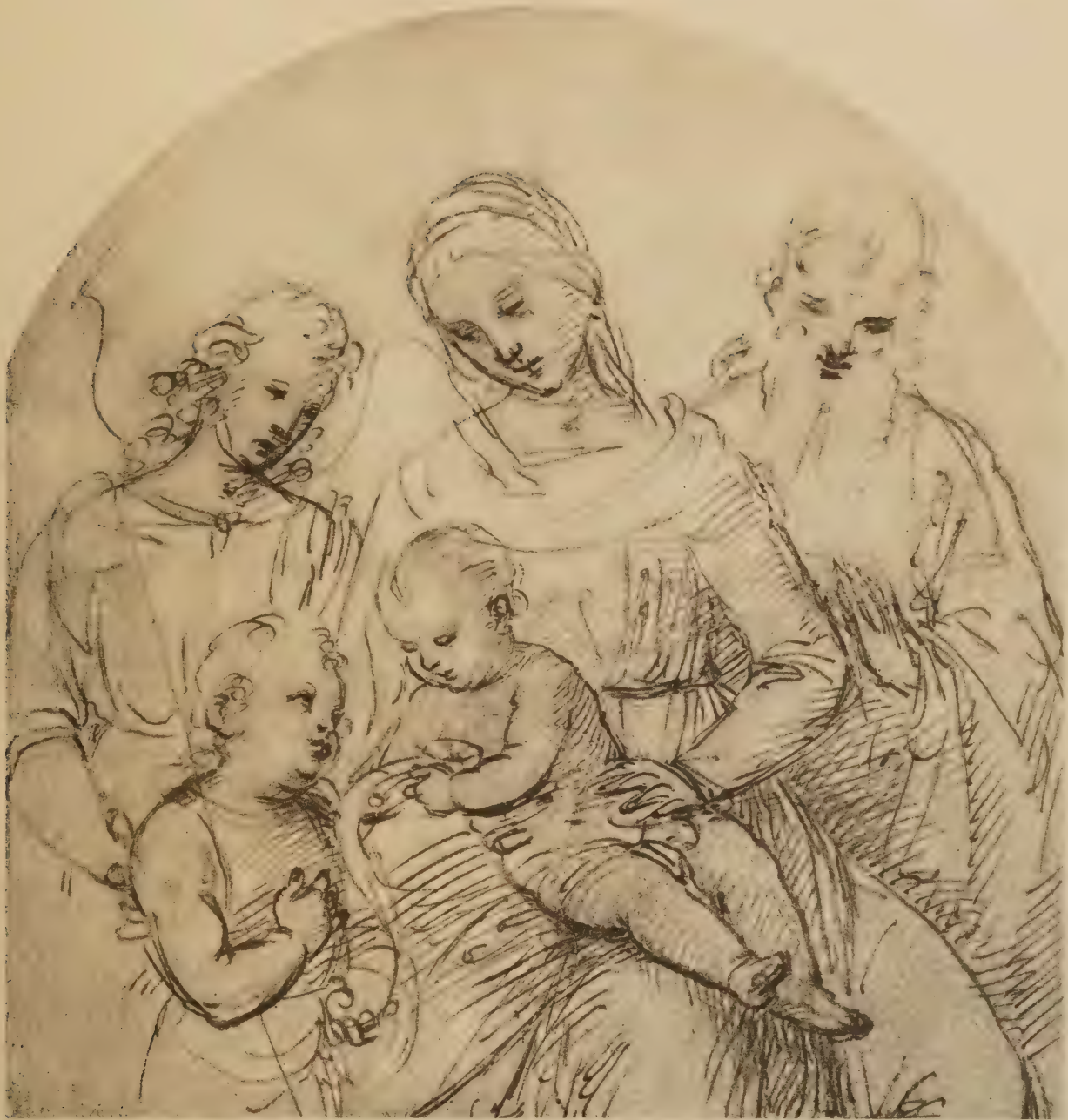
Etude pour une sainte famille, première idée pour la Vierge de Teranova